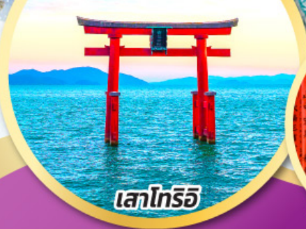
เสาโทริอิ