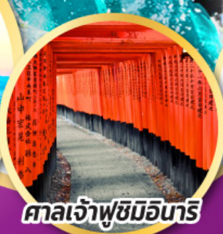
ศาลเจ้าฟูชิมิอินาริ