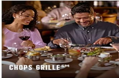
CHOPS GRILLE SM