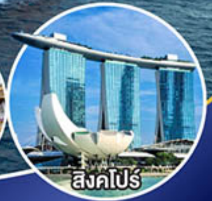
สิงคโปร์