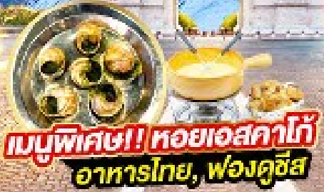
เมนูพิเศษ! หอยเอสคาโก้ อาหารไทย, ฟองดูซีส