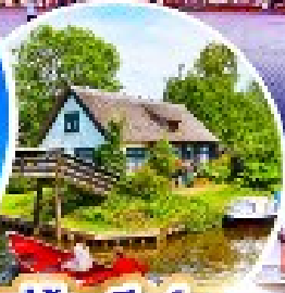
หมู่บ้านกีร์รุน