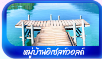
หมู่บ้านอิชเลทวอลด์