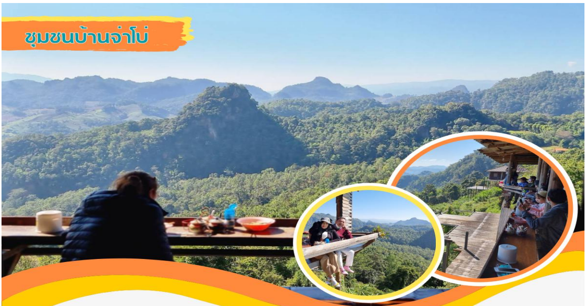
ชุมชนบ้านจ่าโบ้

☺บริการอาหารเช้า ณ ห้องอาหารของที่พัก (4) หลังอาหาร คณะทำการ Check Out นำท่านเดินทางสู่ บ้านจ่าโบ้ ทิวทัศน์สุดอลังการที่ซ่อนตัวอยู่ในหมู่บ้านเล็ก ๆ จนได้รับการกล่าวขานว่า “ก๊วยเตี้ยวหลักร้อย วิวหลักล้าน”