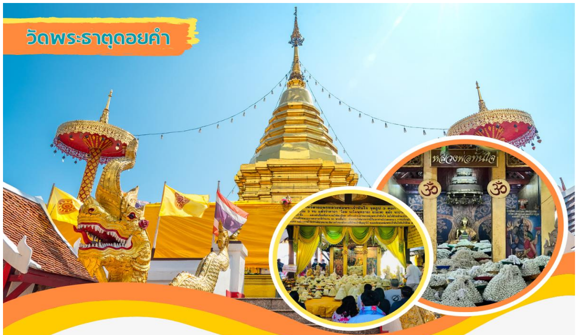
วัดพระธาตุดอยคำ

นำคณะเดินทางสู่ พระธาตุดอยคำ เพื่อสักการะพระธาตุศักดิ์สิทธิ์ และขอพรกับหลวงพ่อกันใจ ด้วยดอกมะลิธรรมนิยมเฉพาะถิ่นของวัดพระธาตุดอยคำแห่งนี้