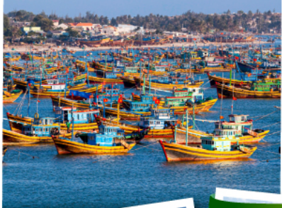
หมู่บ้านชาวประมงมุยเน่