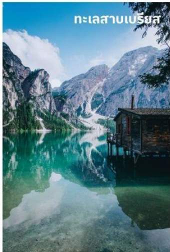
ทะเลสาบเบรียส

บริการอาหารกลางวัน ณ ภัตตาคาร นำท่านเดินทางสู่ ทะเลสาบเบรียส (Lake Braies) หรือ (Pragser Wildsee) ใช้เวลาเดินทางประมาณ 40 นาที เป็นทะเลสาบที่ได้ขึ้นชื่อว่าไข่มุกแห่งโดโลไมท์ ตั้งอยู่ในหุบเขาโดโลไมท์และยังได้เป็นส่วนหนึ่งในมรดกโลก (Unesco) อีกด้วย