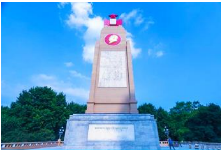
อนุสาวรีย์ฝิ่งหง

ชมและถ่ายภาพกับ รูปปั้นตึกตาคิมะยักซ์ 网红大雪人 เป็นตึกตาคิมะขนาดใหญ่ความสูง 18 เมตร ที่ทางเทศบาลเมืองฮาร์บินจัดทำขึ้นในช่วงฤดูหนาวของทุกปี เช่นเดียวกับการประดับต้นคริสต์มาสในช่วงเทศกาลของชาวตะวันตก จนกลายเป็นสัญลักษณ์แห่งฤดูหนาวของเมืองฮาร์บิน