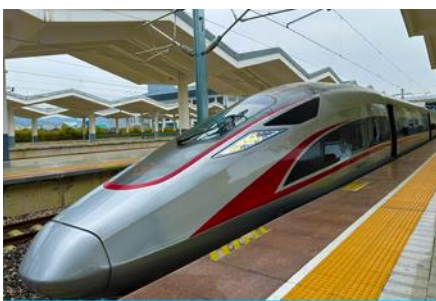
นั่งรถไฟความเร็วสูง

พักที่ XINGYU INTERNATIONAL หรือ โรงแรมระดับ 4 ดาวท้องถิ่น