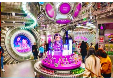
ร้าน POP MART

วันที่ทำ จิวจ้ายโกว-จินเจียงกวน-ขึ้นรถไฟความเร็วสูง-นครเฉิงตู-ช้อปปิ้งถนนซุนซีลู่ร้าน POP MART