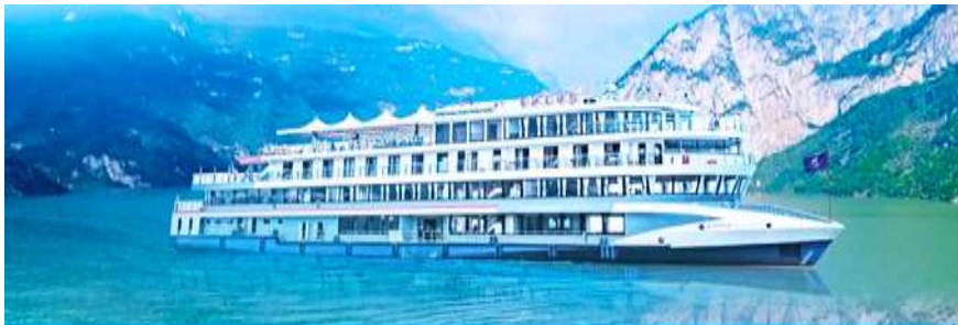
ล่องเรือชมเขื่อนสามผา