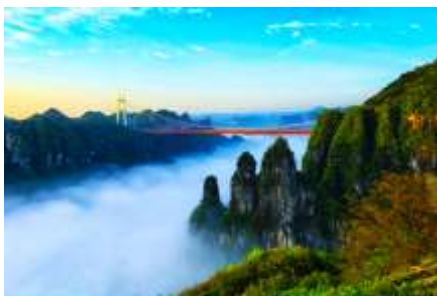
อุทยานป่าไม้แห่งชาติไฉ่จ้าย