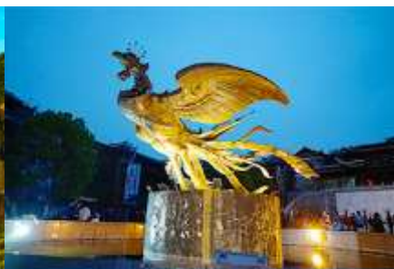
เมืองโบราณฟงหวง