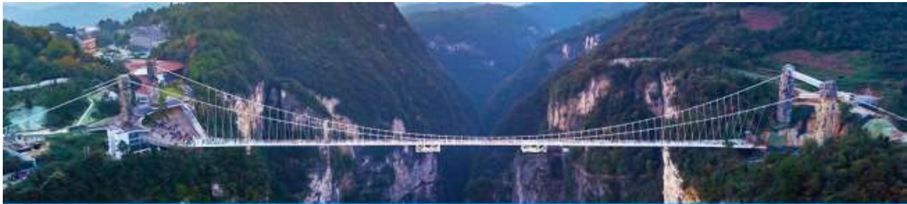
สะพานกระจกข้ามหุบเขาแกรนด์แคนยอน

หลังอาหารให้ท่านพักผ่อนตามอัธยาศัย หรือ ท่านสามารถเลือกซื้อ โปรแกรมเสริมซึ่งเป็น โปรแกรมท่องเที่ยวที่ไม่ได้รวมอยู่ในรายการท่องเที่ยว ได้แก่ โปรแกรมเที่ยวสะพานกระจกที่ถูกสร้างล้อมหุบเขาที่สูงที่สุดในโลก สะพานกระจกจางเจียเจีย (张家界大峡谷玻璃桥) ในเขตอุทยานแกรนด์แคนยอน ทำทนายท่านด้วยการเดินผ่าน สะพานพื้นกระจกใสที่มีความสูงจากพื้น 980 ฟุต โดยมีความยาวของสะพาน 400 เมตร สะพานที่น่าหวาดเสียวแห่งนี้ออกแบบ โดย Haim Dotan วิศวกรชาวอิสราเอล โดยต้องการสร้างสะพานกระจกเพื่อเชื่อมยอดเขาสองยอดเข้าไว้ด้วยกัน สามารถรองรับนักท่องเที่ยวได้คราวละ 800 คนพร้อมกัน สะพานนี้เป็นอีกหนึ่งไฮไลท์สำหรับผู้มาเยือนจางเจียเจีย