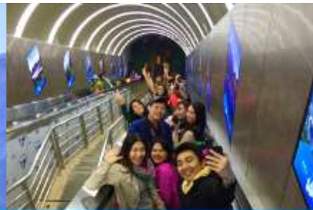
บันไดเลื่อนทะเลภูเขา