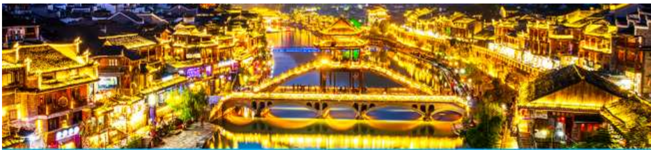
เมืองโบราณฟงหวง

จากนั้นนำท่านเดินทางสู่ เมืองโบราณฟงหวง (เมืองหงส์) 凤凰古城 ใช้เวลาเดินทางประมาณ 2 ชั่วโมง เมืองนี้ตั้งอยู่ในเขตปกครองตนเองของชนเผ่าถู่เจีย ตั้งอยู่ริมแม่น้ำฉวี่เจียงทางทิศตะวันตกของมณฑลหูหนาน ล้อมรอบด้วยขุนเขาเสมือนด่านช่องแคบภูเขาฟงหวง ตั้งเด่นตระหง่านเสมือนป้อมปราการ ชานน้ำฉวี่เจียงใสสะอาดราวน้ำบริสุทธิ์ที่ถูกคลื่นกลองจมนองเห็นกันลำธาร ชุมชนที่เป็นบ้านเรือนจีนโบราณแบบยกพื้นสูงเรียงรายกันริมแม่น้ำ ช่างเป็นทัศนียภาพที่สวยงามมีเสน่ห์ของเมืองโบราณฟงหวง ราวกับดินแดนมนุษย์ที่สร้างอยู่บนสวรรค์.. *** นำท่านนั่งรถเมล์ของเมืองโบราณฟงหวงเข้าสู่โรงแรมในเมืองเก่า * กระเป๋าสัมภาระรวมค่าพนักงานขนจากรถบัสไปโรงแรมแล้ว