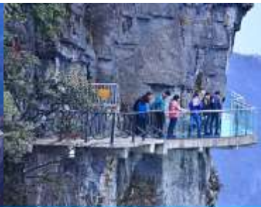
หน้าพลาวยฟ้าทางเดินกระจก