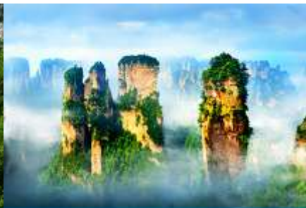
ภูเขาอวตาร