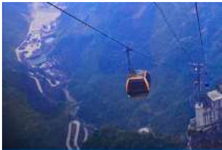
กระเช้าขึ้นเทียนเหมินซาน