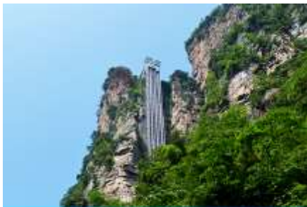
ลิฟท์แก้วไปหลง

หลังอาหารนำท่านเดินทางเข้าที่พัก หรือท่านสามารถเลือกซื้อโปรแกรมเสริม เป็นบัตรชมการแสดง ชุด The Love Story of a Wooden man and Fairy fox หรือที่เรียกกันในหมู่นักท่องเที่ยวไทยว่า โชว์จิ้งจอกขาว เป็นการแสดงกลางแจ้งที่ทุ่มทุนสร้างอย่างสุดอลังการ เป็นการแสดงที่น่าดูชมที่สุดในเมืองจางเจี๋ยเจี๋ย การแสดงชุดนี้ใช้ภูเขาประติมากรรมเป็นฉากหลังประกอบการแสดง ซึ่งให้ความรู้สึกสมจริงเสมือนผู้ชมและนักแสดงอยู่ท่ามกลางธรรมชาติ ใช้ทีมงานนักแสดงหลายร้อยคน และระบบแสง สี เสียงที่ทันสมัยประกอบการแสดง อัตราค่าบริการสำหรับโปรแกรมเสริมการแสดงชุด The love Story of Wooden man and Fairy Fox ท่านละ 400 หยวน (หรือ 2,000 บาทขึ้นอยู่กับอัตราแลกเปลี่ยน) ระยะเวลาที่ใช้ในการเที่ยวชมการแสดง ประมาณ 3 ชั่วโมง รวมเวลาเดินทางไป กลับค่าบริการรวม ค่าบัตรเข้าชม ค่ารถรับ ส่ง และค่าน้ำดื่มของไกด์ท้องถิ่น พักที่ ZHENMIAN HOTEL โรงแรมระดับ 4 ดาวหรือเทียบเท่าจางเจี๋ยเจี๋ย