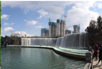
สวนน้ำตก Kunming Waterfall Park