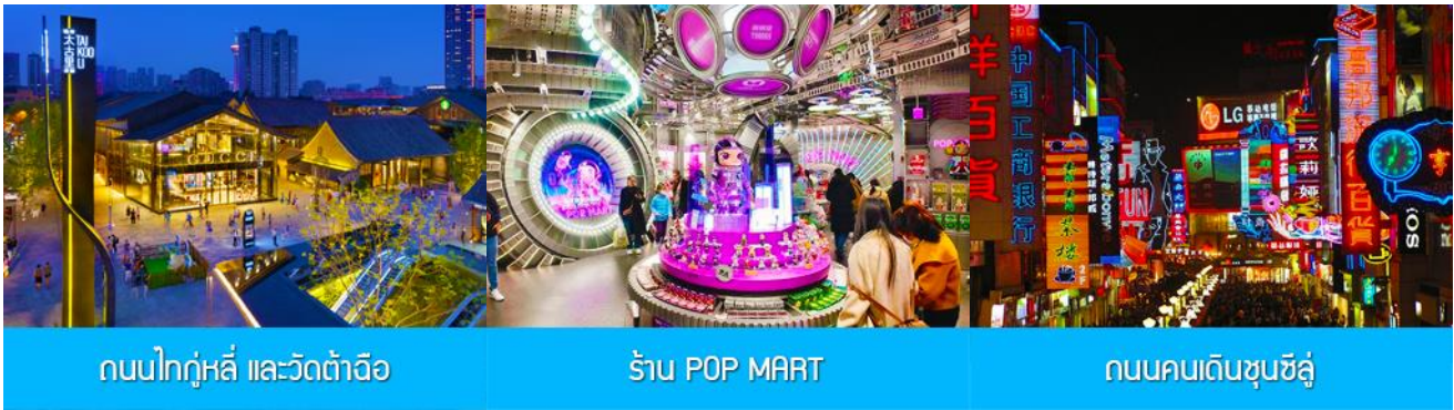
ถนนไท่กุ่หลี่ และวัดต้าฉือ