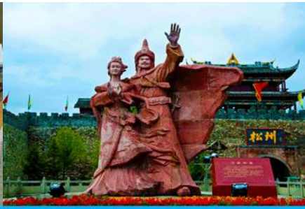
เมืองโบราณซงพาน