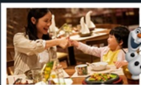
อาหารเข้าในห้องพักอาหารดิสนีย์