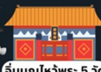
อิมบูนไหว้พระ 5 วัด