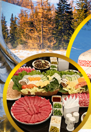
สุกัมองโก