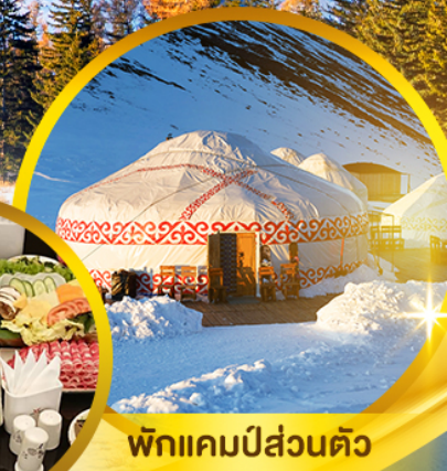
พักแคมป์ส่วนตัว