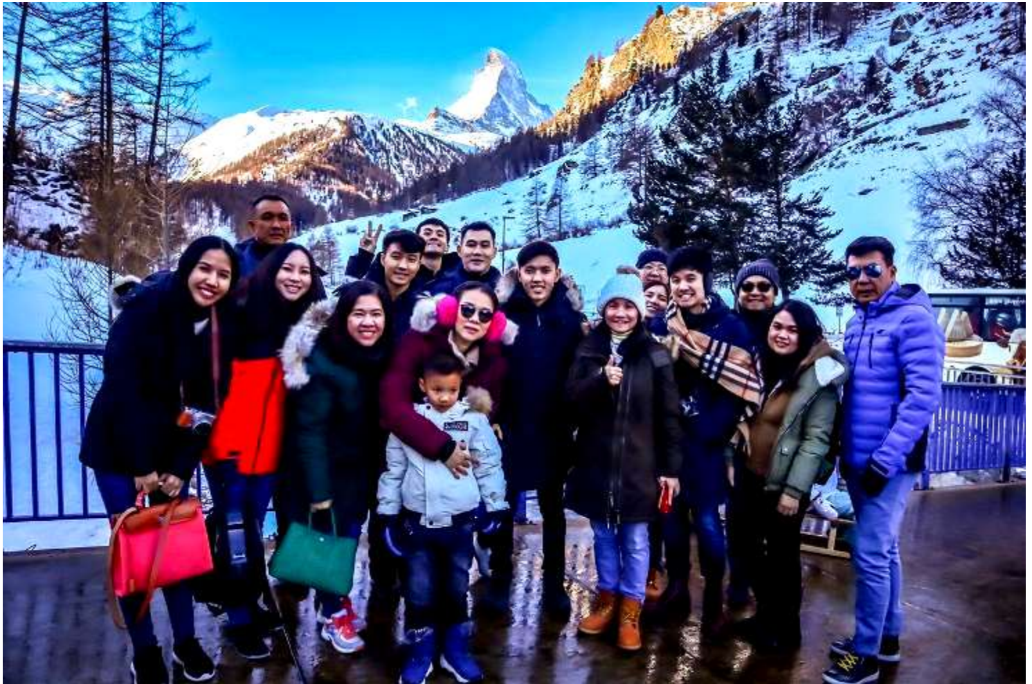
ยุโรปตะวันออก 9วัน TG DELUXE พัก Hallstatt เดินทางปีนํ 29ธ.ค.-06ม.ค.2562(จำนวน28ท่าน)