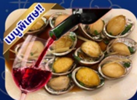
ซีฟู้ด ฝ่ามือไฮบีต