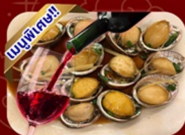
ซีฟู้ด เป้าอื้อโฮบิตแดง