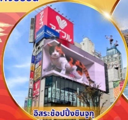
อิสระช้อปปิ้งชินจูกุ