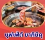
บุฟเฟ่ต์ ยากินิกุ

THAI สายการบินไทย บริการอาหารร้อน นน.กระเป๋า 23 กก. เอนเตอร์เทนเมนท์ฟรี