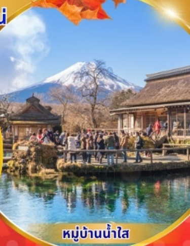
หมู่บ้านน้ำใส