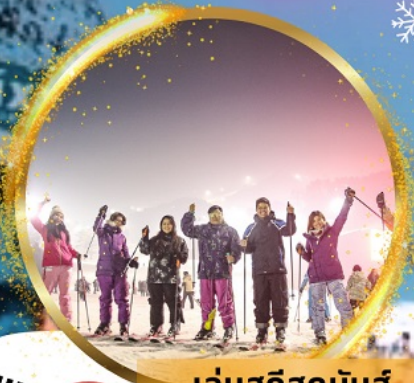
เล่นสกีสุดมันส์