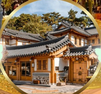
หมู่บ้านโบราณอินพยอง