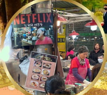
สตรีทฟู้ดตลาดกวางจง