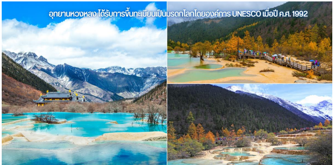
อุทยานหวงหลง ได้รับการขึ้นทะเบียนเป็นมรดกโลกโดยองค์การ UNESCO เมื่อปี ค.ศ. 1992

URGENT! เส้นทางนี้...เดินทางสู่พื้นที่สูงมากกว่า 2,500 เมตรจากระดับน้ำทะเล เนื่องจากมีความดันอากาศและออกซิเจนลดลง อาจจะทำให้เกิดอาการแพ้ที่ราบสูงได้ หากมีอาการกรุณารีบแจ้งไกด์หรือหัวหน้าทัวร์