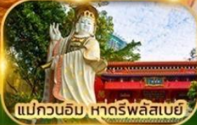
แม่กวนอิม หาดริฟลีสเบย์