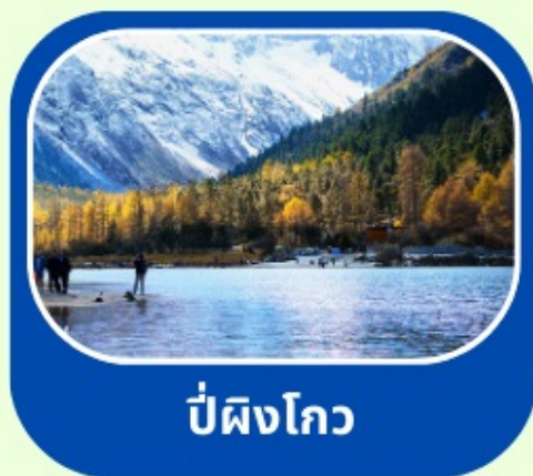
ป่าผิงโกว