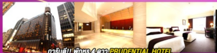
гаринт!! พักหรู 4 ดาว PRUDENTIAL HOTEL ติดถนนนาราน ย่านช้อปปิ้งจิมซาจู้