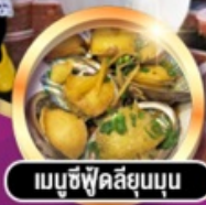
เมมูซีฟู้ดสัญมุน