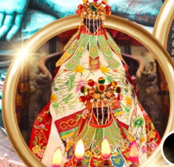
ยืมเงินเจ้าแม่กวนอิมสองห้า