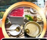
บุฟเฟ่ต์ชาบู เมียร์โมอัน!!