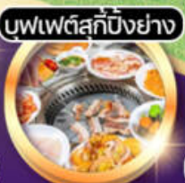
บุฟเฟ่ต์สุกปิ้งย่าง