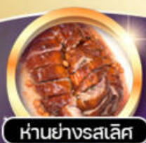
หันย่างรสเลิศ