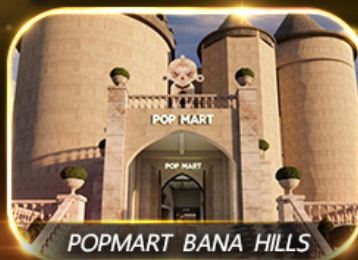
POP MART BANA HILLS

สัมพัสความงามหมู่บ้านฝรั่งเศสที่บานาฮิลล์ ซอปปิง POPMART