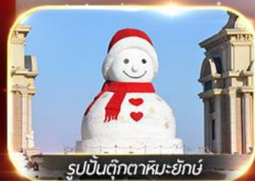
รูปปั้นตุ๊กตาหิมะยักษ์