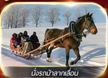
นั่งรถม้าลากเลื่อน

ฟรีนั่งรถม้าลากเลื่อน ชมโชว์ว่ายน้ำน้ำแข็ง แม่น้ำซงหวาเจียง