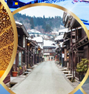
ทาคายาม่า