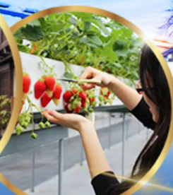
บุฟเฟต์ สตอเบอร์รี่

ราคา เดียว 49,919 บาท รวมภาษีมูลค่าเพิ่ม 7%