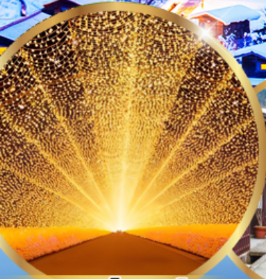
นาบาระ โนะ ซาโตะ