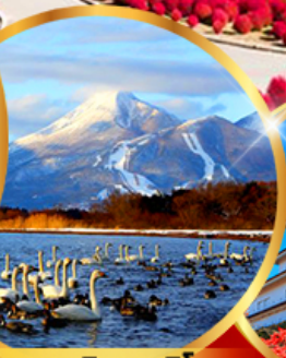
ทะเลสาบอินาวะชิโระ