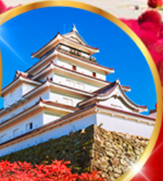
ปราสาทสิรุกะ