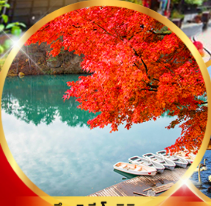
บึง 5 สี โทซึกิคุมะ