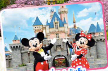
อิสระท่องเที่ยว 1 วันเต็ม