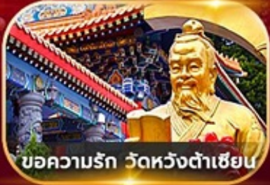
ขอความรัก วัดหวังต้าเซียน