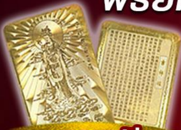
แถมฟรี แผ่นทองเจ้าแม่กวนอิม