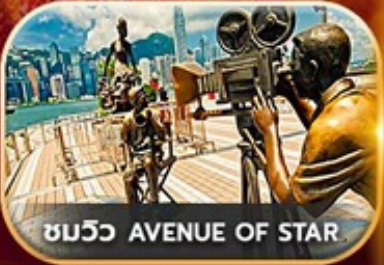
ชมวิว AVENUE OF STAR