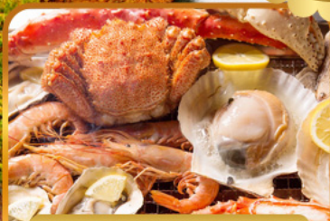
บั้งย่างร้านดังนั้นตะ