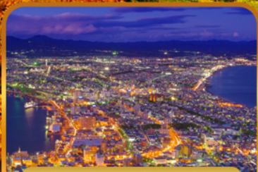
ชมวิวฮาโกดาเตะ