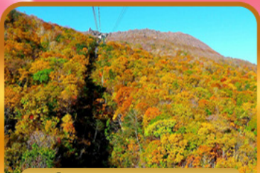
นั่งกระเช้าอุซุซัง