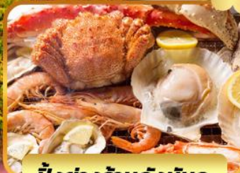
บั้งย่างร้านดังน้บดะ