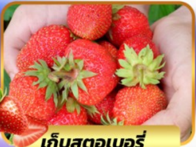
เก็บสตอเบอร์รี่