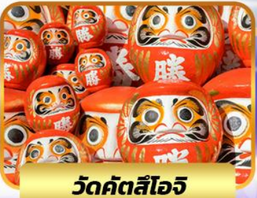
วัดคัตสึโองิ