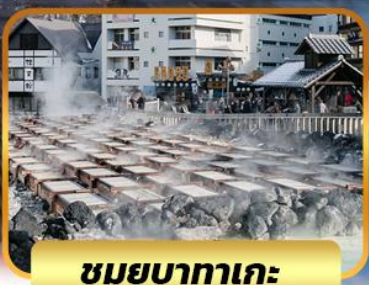
ชมยูบาตาเกะ