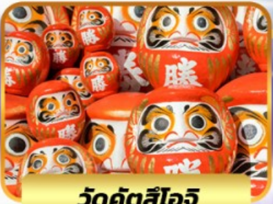
วัดคิตสึโองิ