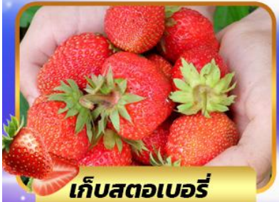
เก็บสตอเบอร์รี่