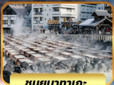
ชมยูกาตาเกะ