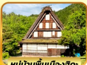
หมู่บ้านพื้นเมืองฮิดะ