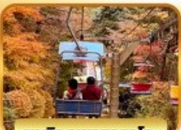
ชมวิวกุเขากาโตะ