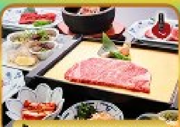
บ๊องย่าง ROKKASEN