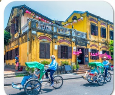
"เมืองโบราณฮอยอัน"