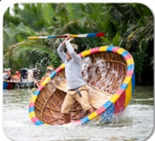
"ล่องเรือกระด้ง"

นั่งกระเช้าที่ยาวที่สุดในโลก ขึ้นสู่บานาฮิลล์ • หมู่บ้านฝรั่งเศส • สวนสนุก FANTASY PARK LE JARDIN D'AMOUR • สะพานมือสีทอง • วัดหลินอึ้ง • เมืองโบราณฮอยอัน หมู่บ้านกิมกาน • ล่องเรือกระด้ง • สะพานมังกร • APEC PARK • ตลาดฮาน