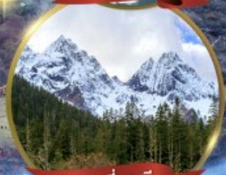
ภูเขาสัตว์น่ารัก