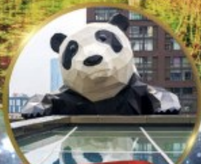
แพนด้ายักษ์

มหัศจรรย์ความงาม อุทยานจิวจ้ายโกว (รวมรถเหมาเที่ยวอุทยานเต็มวัน) ชมอุทยานหวงหลง (รวมกระเช้า) • สัตว์น่ารัก • อุทยานของเขี้ยวโกว (รวมรถอุทยาน) เมืองเก่าชงฟาน • ถนนคนเดินจิมฮลี่ + ไถ่กู๋ฮลี่ • ชมแพนด้ายักษ์ปิ่นตึก