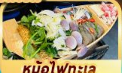
หม้อไฟทะเล