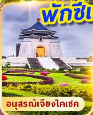
อนุสรณ์เจียงโคเซค