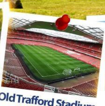
Old Trafford Stadium