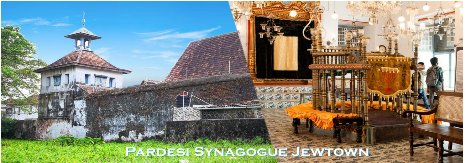
PARDESI SYNAGOGUE JEW TOWN

นำท่านชม โบสถ์เซนต์ฟรานซิส (ST. Francis Church) สร้างโดยนักบวชในคริสต์ ศาสนานิกายโรมันคาทอลิก ตามสถาปัตยกรรมแบบยุโรป ในปีคริสต์ศักราชที่ 1503 เชื่อกันว่าเป็นโบสถ์ที่เก่าแก่ที่สุดในเมืองโคชิน และเป็นสถานที่เก็บศพของวาสิโกดา กามา นักสำรวจชาวโปรตุเกสที่สิ้นชีวิต ณ เมืองโคชิน เมื่อปีพุทธศักราชที่ 2067 ก่อนจะย้ายศพไปเก็บไว้ที่ประเทศโปรตุเกสในเวลาต่อมา นำท่านชม ชุมชนชาวยิว หรือที่เรียกว่า "Jew town" ชุมชนแห่งนี้ยังคงเต็มไปด้วยร้านค้าตลอดสองข้างทางถนน มีทั้งร้านขายเครื่องเทศ และพริกไทย ปัจจุบันยังเต็มไปด้วยผู้คนที่มาค้าขายแลกเปลี่ยนกันไม่ต่างจากอดีต นำท่านชม มหาวิหารซางตาครูซ (Santa Cruz cathedral) สร้างขึ้นในปีคริสต์ศักราช 1505 โดยชาวโปรตุเกส เป็นโบสถ์ที่สร้างขึ้น รองมาจากโบสถ์เซนต์ฟรานซิส (ST. FRANCIS CHURCH) โดยโบสถ์แห่งนี้สร้างด้วยสถาปัตยกรรมแบบโกธิค