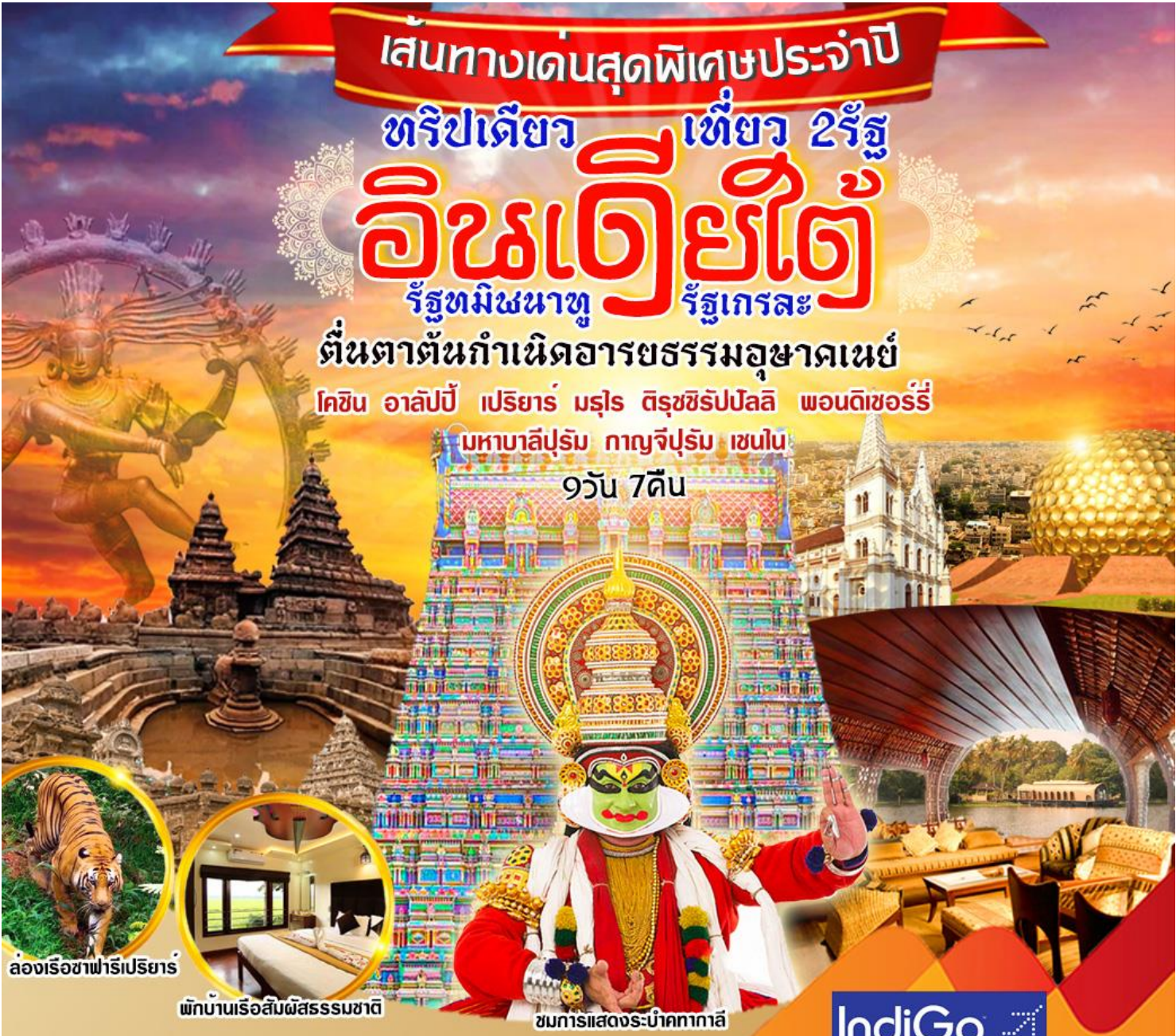
ล่องเรือซาฟารีเปรियาร์