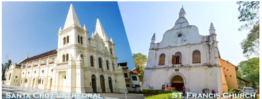
SANTA CRUZ CATHEDRAL

ปราการโคชิน สร้างขึ้นในปี พ.ศ. 2111 ภายในโบสถ์มีการใช้วัสดุก่อสร้างนำเข้าจากประเทศจีน มณฑลกว๋างตุ้ง คือ กระเบื้องปูพื้นเคลือบแบบภาพเขียนมือซึ่งภายในกระเบื้องแต่ละแผ่นจะไม่ซ้ำลวดลาย อีกทั้งยังมีการแสดงสิ่งของล้ำค่าซึ่งประกอบไปด้วยใบเบิ้ลตุ้เก็บพระคัมภีร์ มงกุฎทองเป็นต้น