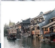
เมืองโบราณผานหลงกู่เจิน