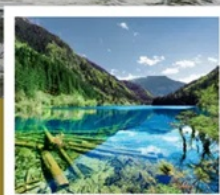
จั๋วจ้ายโกว

จาก 8 ชม. เหลือ 2 ชม. เร็วทันใจด้วยรถไฟความเร็วสูง เฉิงตู - จั๋วจ้ายโกว