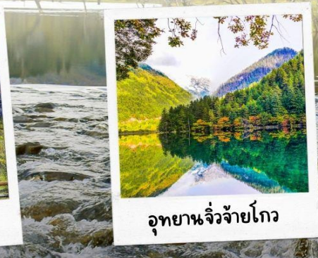
อุทยานจี๋จ้ายโกว