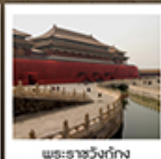
พระราชวังกู่กง