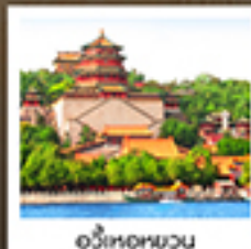
อวี่เหอหยวน