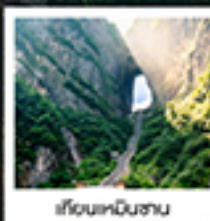
ฟูหลงเจิน

ทรนดึทกษยน / สฟททกัฟฟัทวฟุท / ททฟยทททททท / รรฟองทว / ปรตุทวสรท / ไร้งทงจ้งจ้งททท / ททฟยทททททท สวททททททททท / ทททททททท / ท้องฟูหลงเจิน / ส้องรือทททททททท / ททเมืองโบราณฝ่งหวงทททท