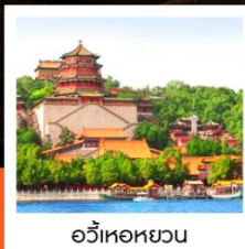
อวิ๋เหอหยวน