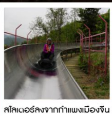
สไลเดอร์ลงจากกำแพงเมืองจีน