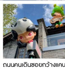
ถนนคนเดินชอยกว้างแคบ