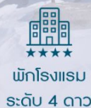
พักโรงแรม ระดับ 4 ดาว